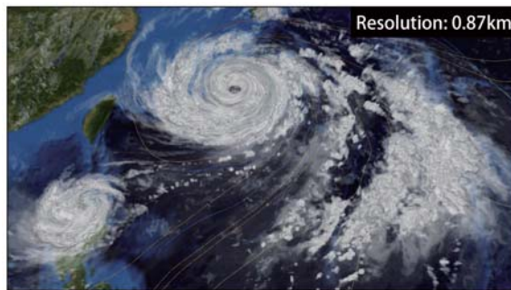
Resolution: 0.87 km