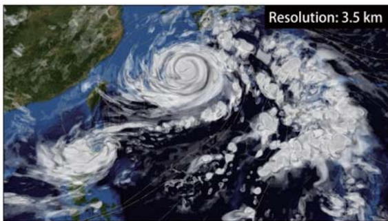
Resolution: 3.5 km